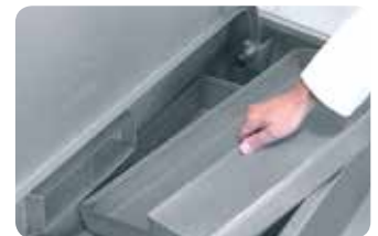
Triple filtro. Triple filter.

RA00000965 COD. 3528 RA00001058 COD. 13673