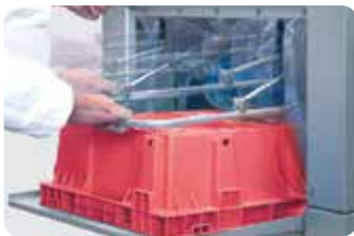
Altura regulable. Adjustable height.