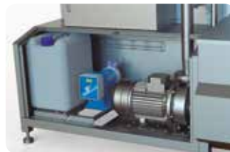
Incluye: dosificador de jabón. Includes: soap dispenser.