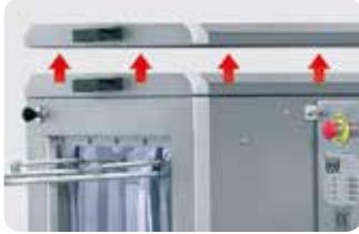
Tapa superior extraíble. Detachable cover.